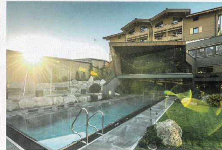
Ob im Bergsee oder im beheizten Outdoor-Pool, der hoteleigene Wasser- und Wellnessbereich ist genau der richtige Ort, um die Seele baumeln zu lassen.